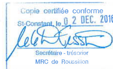
SCHÉMA D'AMÉNAGEMENT RÉVISÉ

Signature of the Prefect PRÉFET Signature of the Interim General Director DIRECTRICE--GÉNÉRALE PAR INTÉRIM 2016-08-31 DATE