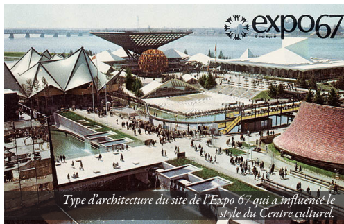
Type d'architecture du site de l'Expo 67 qui a influencé le style du Centre culturel.

Déjà, à ce moment, on offre au Centre une programmation très populaire de cours et d'ateliers culturels et artistiques. Le hall d'entrée sert de galerie d'exposition pour les artistes et l'auditorium, nommé salle Jean-Pierre-Houde en 1980, offre des spectacles, des séances de cinéma et des conférences. Dès sa fondation, le Centre viendra en appui aux associations culturelles et récréatives locales et soutiendra le développement social et communautaire.