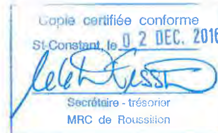
SCHÉMA D'AMÉNAGEMENT RÉVISÉ

PRÉFET DIRECTRICE--GÉNÉRALE PAR INTÉRIM 2016-08-31 DATE